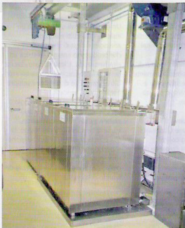
Impianto di lavaggio con detergente, risciacquo idrocinetico, protezione e asciugatura stampi.

Le macchine a ultrasuoni per il lavaggio stampi sostituiscono tutti gli impieghi con solventi o con prodotti chimici aggressivi, per questo sono altamente ecologiche e sicure".