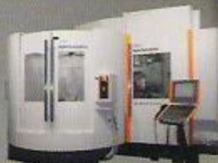
MIKRON HPM 1350U