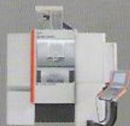
MIKRON HPM 800U